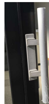
写真：トレーに張り付けて使用 ドアノブに張り付けて使用